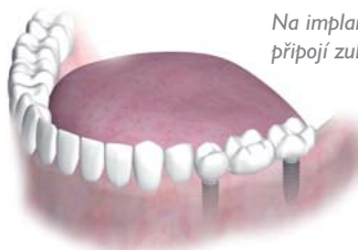
Na implantáty se připojí zubní můstky