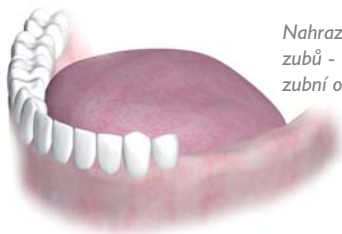
Nahrazení několika zubů - tzv. zkrácený zubní oblouk