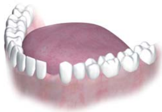
Nahrazení jednoho chybějícího zubu